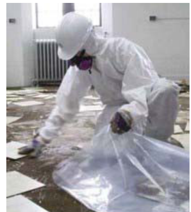
ਫਰਸ਼ ਤੋਂ ਐਸਬੈਸਟਸ ਹਟਾਉਂਦਾ ਹੋਇਆ ਸੁਰੱਖਿਅਤ ਕਾਮੇਂ

www.worksafebc.com ਤੇ ਜਾਓ ਅਤੇ “ਐਸਬੈਸਟਸ” ਬਾਰੇ ਲੱਭੋ।