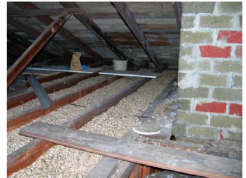
ਐਸਬੈਸਟਸ- ਵਾਲੀ ਵਰਮੀਕੁਲਾਈਟ ਐਟਿਕ ਇਨਸੂਲੇਸ਼ਨ

ਐਸਬੈਸਟਸ ਇੱਕ ਸੰਭਾਵੀ ਜਾਨ-ਲੇਵਾ ਖਣਿਜ ਹੈ ਜੋ ਬਹੁਤ ਸਖ਼ਤ ਹੈ ਅਤੇ ਰਸਾਇਣਾਂ ਅਤੇ ਗਰਮੀ ਦਾ ਇਸਤੇ ਕੋਈ ਖਾਸ ਅਸਰ ਨਹੀਂ ਹੁੰਦਾ। 1990 ਤੱਕ, ਇਸ ਨੂੰ ਆਮ ਤੌਰ ਤੇ ਛੱਤਾਂ ਦੀ ਸਜਾਵਟ, ਡਰਾਈ ਵਾਲ ਮਡ, ਫਰਸ਼ਾਂ ਅਤੇ ਐਟਿਕ ਦੀ ਇਨਸੂਲੇਸ਼ਨ ਲਈ ਵਰਤਿਆ ਜਾਂਦਾ ਸੀ। ਮੁਰੰਮਤ ਵੇਲੇ ਜਾਂ ਬਿਲਡਿੰਗ ਢਾਹਣ ਵੇਲੇ ਜੇ ਇਨ੍ਹਾਂ ਜਗ੍ਹਾਂ ਨੂੰ ਛੇੜਿਆ ਜਾਵੇ ਜਿਵੇਂਕਿ ਇਨ੍ਹਾਂ ਵਿੱਚ ਮੋਰੀ ਕੀਤੀ ਜਾਵੇ, ਆਰੇ ਨਾਲ ਚੀਰਿਆ ਜਾਵੇ, ਰੇਗਮਾਰ ਨਾਲ ਰਗੜਿਆ ਜਾਵੇ ਜਾਂ ਤੋੜਿਆ ਜਾਵੇ ਤਾਂ ਕਾਮੇਂ ਅਤੇ ਪਰਵਾਰ ਦੇ ਜੀਅ ਐਸਬੈਸਟਸ ਦੀ ਧੂੜ ਸਾਹ ਰਾਹੀਂ ਲੈ ਸਕਦੇ ਹਨ। ਜੇ ਕਰ ਲੋਕ ਕਾਫ਼ੀ ਐਸਬੈਸਟਸ ਫ਼ਾਈਬਰ ਸਾਹ ਰਾਹੀਂ ਅੰਦਰ ਲੰਘਾ ਲੈਂਦੇ ਹਨ ਤਾਂ ਉਨ੍ਹਾਂ ਦੇ ਫੇਫੜਿਆਂ ਨੂੰ ਪੱਕੇ ਤੌਰ ਤੇ ਨੁਕਸਾਨ ਹੋ ਸਕਦਾ ਹੈ ਅਤੇ ਫੇਫੜਿਆਂ ਦਾ ਕੈਂਸਰ ਹੋ ਸਕਦਾ ਹੈ।