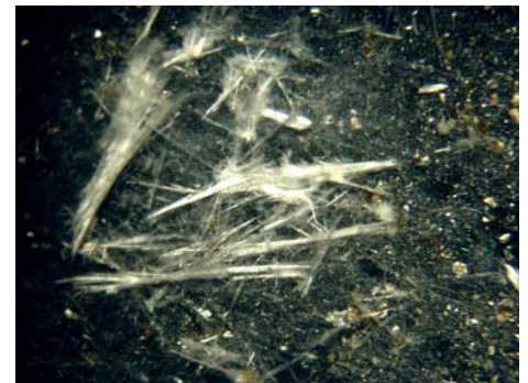
ਵਰਮੀਕੁਲਾਈਟ ਐਟਿਕ ਇਨਸੂਲੇਸ਼ਨ ਵਿੱਚ ਐਸਬੈਸਟਸ ਫ਼ਾਈਬਰ

ਤੁਸੀਂ ਇਮਾਰਤ ਦੇ ਸ਼ੱਕੀ ਹਿੱਸਿਆਂ ਦੇ ਸੈਂਪਲ ਲੈਬਾਰਟਰੀ ਵਿੱਚ ਟੈਸਟ ਲਈ ਭੇਜ ਸਕਦੇ ਹੋ। ਇਹ ਤੁਹਾਨੂੰ ਆਪਣੇ ਆਪ ਨਹੀਂ ਕਰਨਾ ਚਾਹੀਦਾ - ਬਲਕਿ ਐਸਬੈਸਟਸ ਦੇ ਖ਼ਤਰਿਆਂ ਦਾ ਮੁੱਲਾਂਕਣ ਕਰਨ ਦੀ ਯੋਗਤਾ ਪਰਾਪਤ ਕਿਸੇ ਸਰਵੇਅਰ ਜਾਂ ਸਲਾਹਕਾਰ ਕੋਲੋਂ ਨਮੂਨੇ ਇਕੱਠੇ ਕਰਵਾਉਣੇ ਚਾਹੀਦੇ ਹਨ। ਕੋਈ ਨਮੂਨਾ ਇਕੱਠਾ ਕਰਨ ਤੋਂ ਪਹਿਲਾਂ ਉਸਦੀ ਕਾਬਲੀਅਤ ਦਾ ਪਰਮਾਣ ਪਤਰ ਦੇਖੋ। ਯਾਦ ਰੱਖੋ, ਕਿ ਸਾਰੇ ਐਸਬੈਸਟਸ - ਫੁਧੇ ਐਸਬੈਸਟਸ ਸਮੇਤ - ਪਛਾਣੇ ਜਾਣੇ ਚਾਹੀਦੇ ਹਨ!